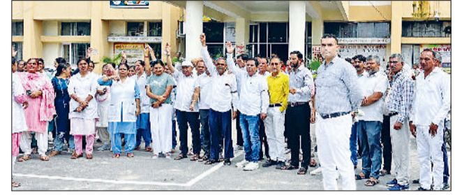
झज्जर। नागरिक अस्पताल के बाहर विरोध प्रदर्शन करते हुए स्वास्थ्यकर्मियों ने सौंपा ज्ञापन।

स्वास्थ्यकर्मियों ने कहा कि यदि सरकार द्वारा इन आदेशों को वापिस नहीं लिया गया तो वे आगामी 10 अगस्त को राज्य स्तरीय बैठक करके आगामी रणनीति बनाएंगे।