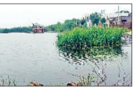
इज्जर। गांव में जमा बरसाती पानी।

क्षेत्र के गांव माजरा दुबलधन में करोड़ों रुपये खर्च कर शुरू की गई जलनिकासी परियोजना धरातल पर विफल होती दिखाई दे रही है। गांव के कन्या स्कूल, हरिजन कॉलोनी व बीमाण पाना सहित कई रिहायशी इलाके जलभराव की चपेट में आ गए हैं। यह जलनिकासी परियोजना चंडाली से लेकर लोहारू कैनाल तक पाइपलाइन के माध्यम से बनाई गई