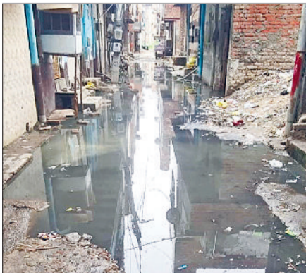
बहादुरगढ़। छोटूराम नगर की गलियों में भरा सीवरज का गंदा पानी।