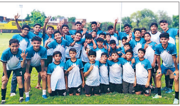
बहादुरगढ़। खुशी का इजहार करते विजेता टीम के सदस्य।