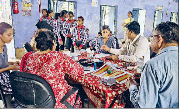
इज्जर। शिविर में स्वास्थ्य जांच कराते हुए विद्यार्थी।