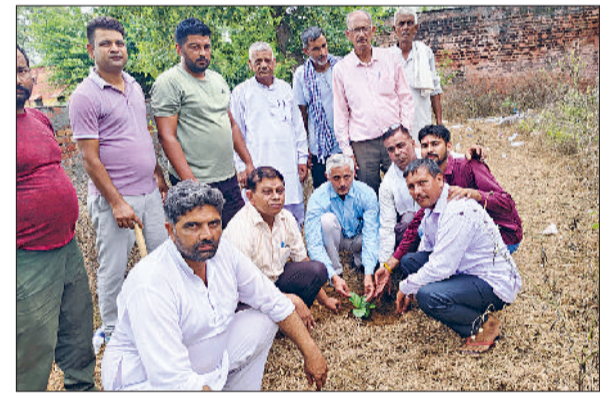
इज्जर। कार्यक्रम के दौरान पौधरोपण करते हुए पैक्स कर्मी।