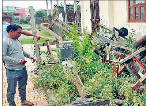
झज्जर। स्टेडियम में पड़ा कबाड़ दिखाते अभिभावक।

बाहर पड़ा है, जिससे मच्छरों का प्रकोप और बढ़ गया है। इस स्टेडियम में बॉक्सिंग के अलावा जिम्नास्टिक, हॉकी और बैडमिंटन विंग भी स्थापित है। इनमें से जहां जिम्नास्टिक खिलाड़ी तो इंडोर स्टेडियम में अपना अभ्यास कर पाते हैं लेकिन मैदान में जलभराव के कारण हॉकी व बैडमिंटन विंग के खिलाड़ियों ने तो मजबूरन स्टेडियम आना ही बंद कर दिया है। अभिभावकों ने जिला प्रशासन से जल्द से जल्द स्टेडियम की सफाई व निकासी की मांग की है।