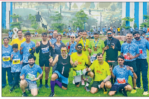
बहादुरगढ़। जीत के बाद खुशी जाहिर करते बीआरजी के धावक।