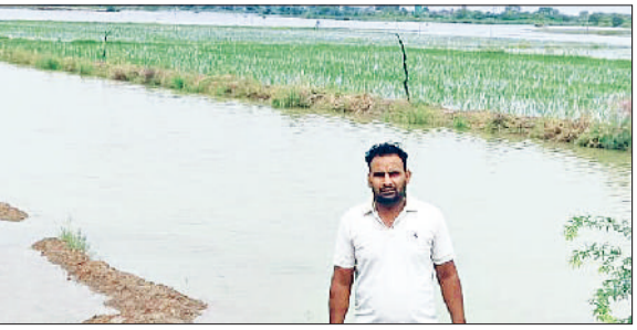
इज्जर। मुनीमपुर के खेतों में हुआ जल भराव।