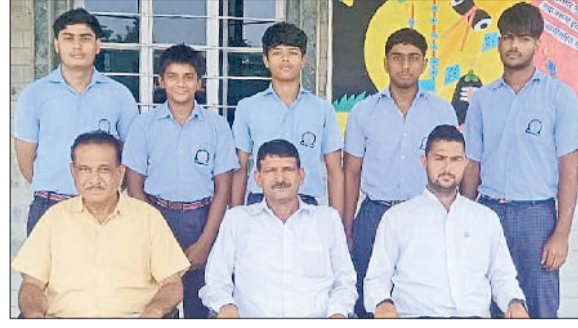
इज्जर। स्कूल प्रबंधन समिति सदस्यों के साथ उपस्थित विजेता खिलाड़ी, विजेता खिलाड़ियों के साथ स्कूल निदेशक व प्रिंसिपल।