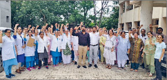
बहादुरगढ़। जियो फेंसिंग के विरुद्ध नारेबाजी करते डॉक्टर व नर्स।

मांगों जैसे ग्रेजुटी, सातवें वेतन आयोग का लाभ, अर्जित अवकाश, ऐच्छिक स्थानांतरण, वेतन विसंगतियां दूर करने, अलाउंस व चिकित्सीय सुरक्षा के लिए आवाज उठा रहे हैं लेकिन सरकार द्वारा इस तरफ कोई ध्यान नहीं दिया जा रहा। स्वास्थ्यकर्मियों ने कहा कि यदि सरकार द्वारा इन आदेशों को वापिस नहीं लिया गया तो वे आगामी 10 अगस्त को राज्य स्तरीय बैठक करके आगामी रणनीति बनाएंगे। स्वास्थ्य कर्मचारियों ने प्रदर्शन के बाद